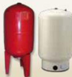
Modelos de tanque hidroneumático, utilizados en la construcción de nuestros productos.